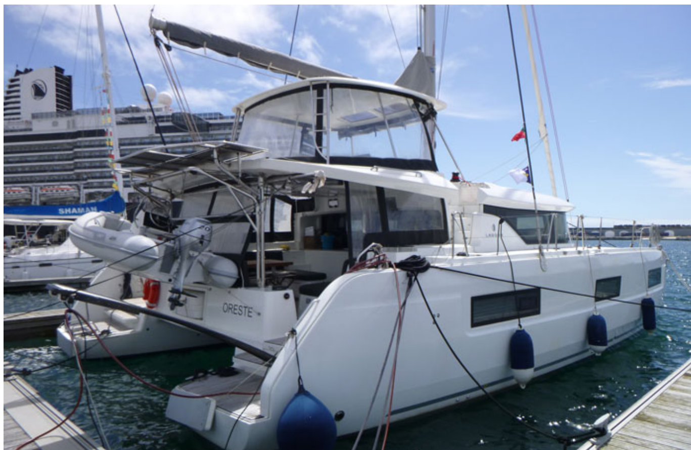
Il Lagoon 46 Oreste finalmente ormeggiato a Ponta Delgada, Capitale delle Azzorre

Riprendiamo la navigazione e, nella notte, avvertiamo le prime avvisaglie della nuova perturbazione che sta per irrompere nell'arcipelago. Sfruttando le prime brezze da Sud Sud-Ovest che cominciano ad intensificarsi con il progredire del giorno, facciamo ingresso a Ponta Delgada. Ormeggiamo al Marina della città capitale delle Azzorre alle 10.00 (ora locale) di venerdì 14 aprile dopo aver percorso 810 miglia in 5 giorni e 2 ore ad una media di 6,6 nodi. Siamo felici di aver condiviso delle bellissime emozioni, sensazioni, di avere maturato indelebili ricordi, e soprattutto, di avere riabbracciato il grande oceano.